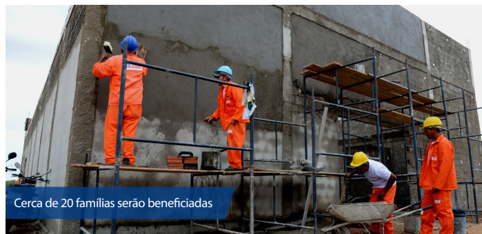
Cerca de 20 famílias serão beneficiadas

A maioria dos agricultores já produz hortaliças como alface, pimentão, coentro e frutas como acerola, mamão, banana, melão. Com a ampliação da área de produção, querem plantar goiabeira, coqueiro e feijão verde. “As pessoas pedem muito coco, tanto seco quanto verde. E o