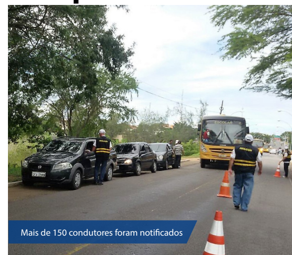
Mais de 150 condutores foram notificados

Quando ocorre a suspensão do direito de dirigir a CNH do condutor infrator é retida, sendo somente devolvida após cumprida a penalidade e o curso de reciclagem. No caso específico do prazo da penalidade imposto pelo órgão de trânsito, o mesmo só começa a vigorar no momento em que a CNH do condutor for registrada pelo Detran/RN como retida.