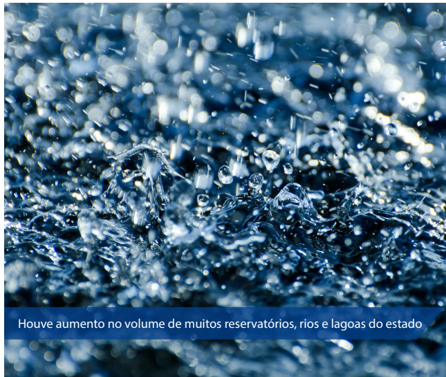
Houve aumento no volume de muitos reservatórios, rios e lagoas do estado