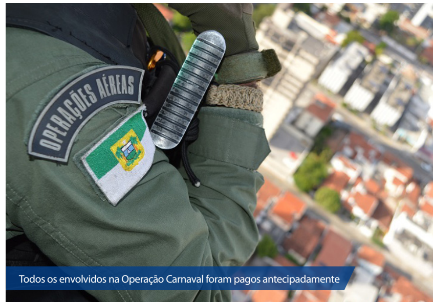
Todos os envolvidos na Operação Carnaval foram pagos antecipadamente